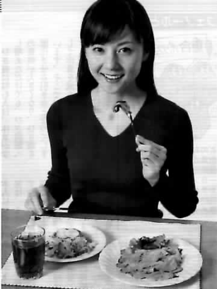
食事でご飯などの主食を減らす糖質制限食

とる。そのさい、ドレッシングは使わない。もし、味に変化が必要ならレモンの絞り汁や、すったシヨウウガなどを使う。